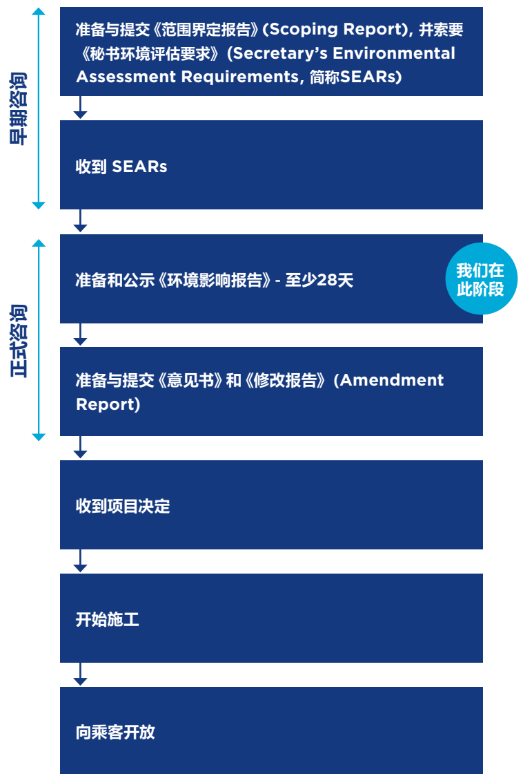
Sydney Metro West 虚拟参与室