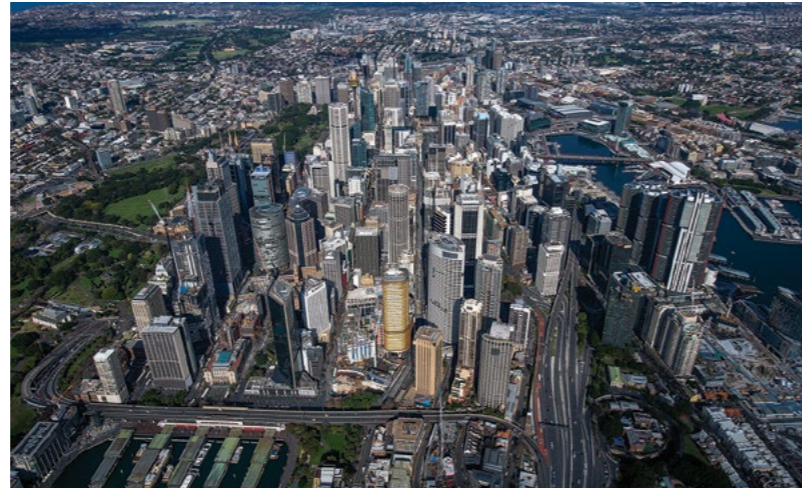
Sydney CBD 鸟瞰图

拟建的地下人行道将使得地铁站可以高效连接到Sydney Metro市中心和西南地铁线及悉尼火车系统，让从Martin Place 一直到Barangaroo之间的交通都很便捷。在早上高峰时段，新车站预计将拥有整个悉尼铁路网中最多的城市客流量，为Wynyard和Town Hall站减轻压力。