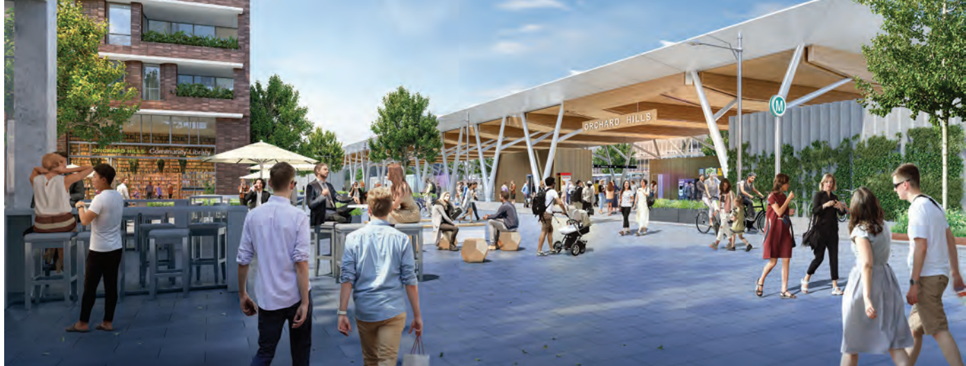
Impressjoni artistika ta' Orchard Hills Station.