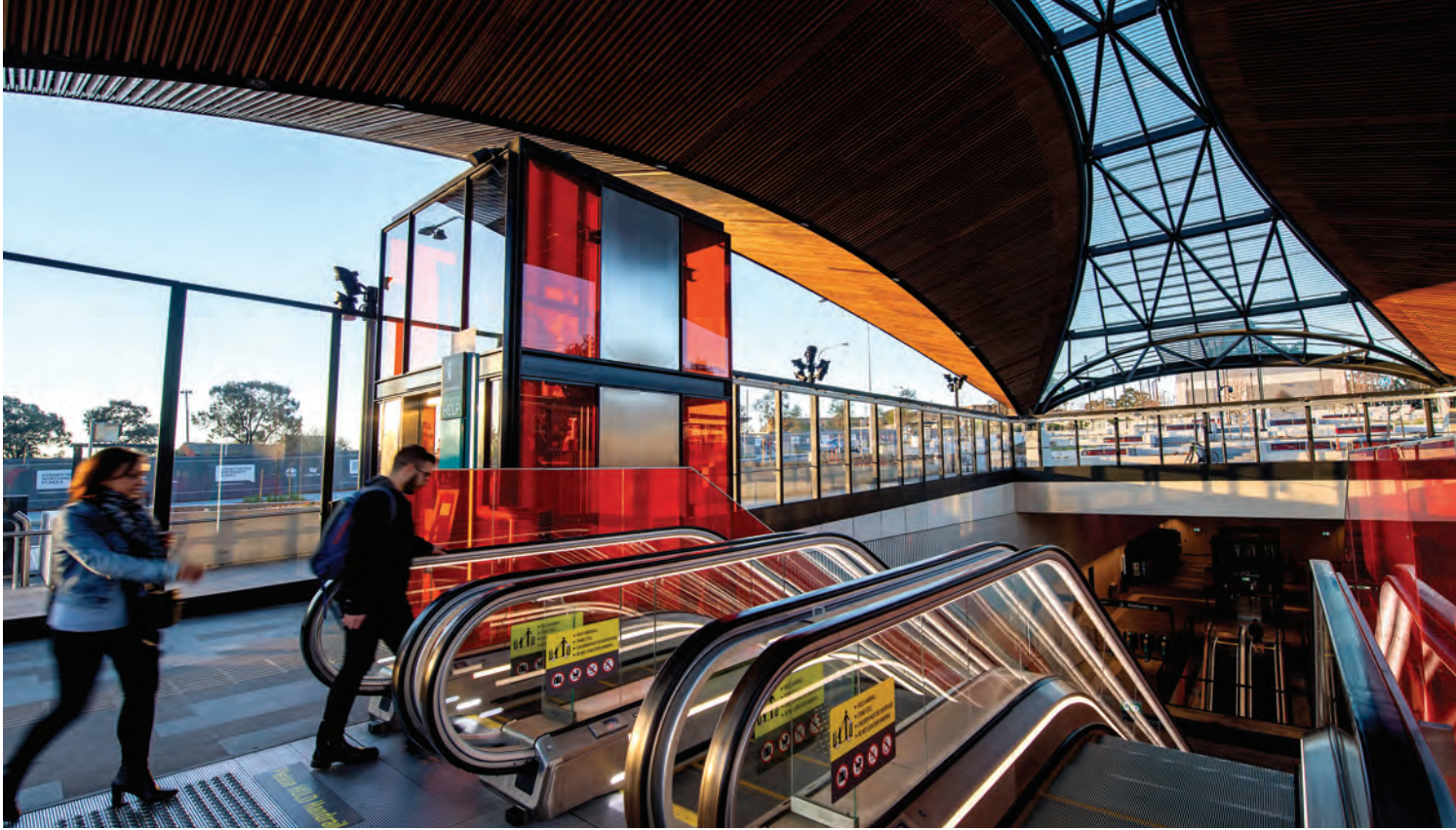
Hills Showground Station, Metro North West Line.