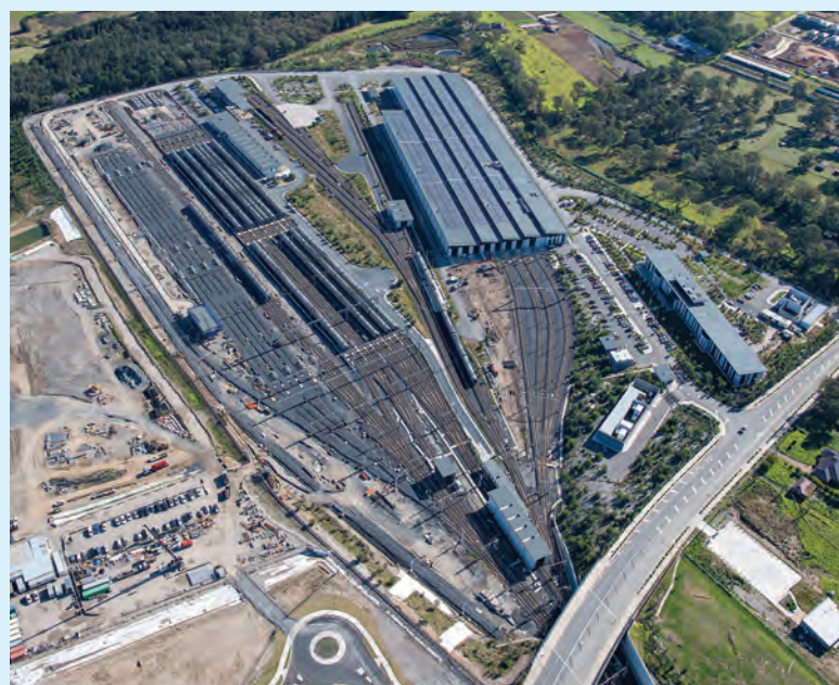
Il-faċilita' għall-ferroviji tal-metro ta' Sydney f'Rouse Hill fuq il-linja Metro North West.

Il-linja ta' l-ajruport il-ġdid ser tkun ikkontrollata mis-Sydney Metro Trains Facility – Orchard Hills.