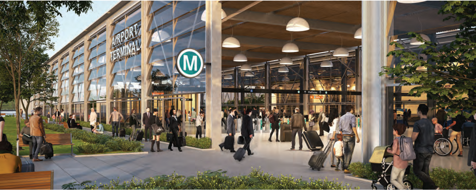
Impressjoni artistika ta' l-Airport Terminal Station.