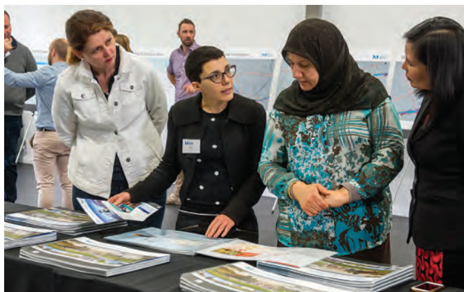
Avveniment komunitarju minn Sydney Metro.

Place managers dedikati kienu ipprovduti waqt il-konsultazzjonijiet bikrin u ser ikomplu jkunu ipprovduti matul id-disinn u t-tkomplija tal-proġett.