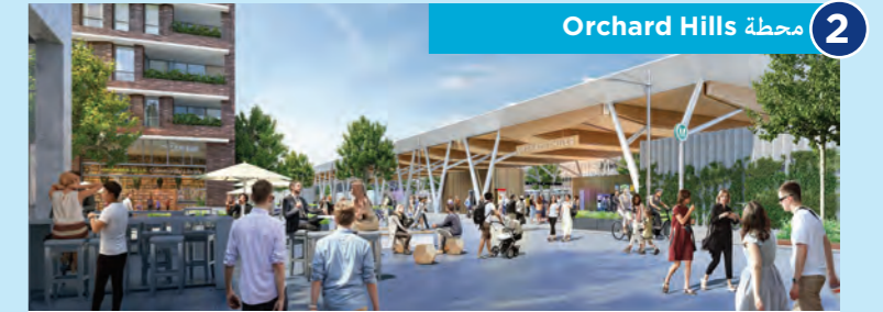
2 محطة Orchard Hills

ستقع محطة مترو St Marys (St Marys Metro Station) المقترحة أسفل محطة Sydney Trains الحالية في الضواحي في St Marys وسيكون لها مدخلين، أحدهما في Station Street والآخر في Harris Street. ستوفر تبادلاً سهلاً وفعالاً ويمكن الوصول إليه مع خط T1 Western الحالي. وستشمل المحطة جسر التقاء جديد يربط بين شمال وجنوب منطقة المحطة.