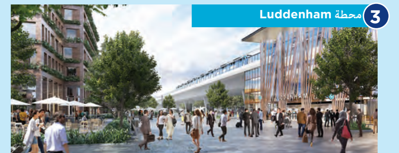
3 محطة Luddenham

ستكون محطة Orchard Hills المقترحة على الجانب الشرقي من Kent Road، شمال Lansdowne Road. سيكون للمحطة مدخل واحد على Kent Road مع توفير مدخل ثانٍ شرق المحطة. ستخدم المحطة منطقة سكنية وتجارية وتمتددة الاستخدامات في المستقبل.