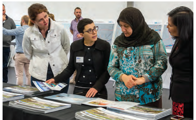
حدث مجتمعي ل Sydney Metro

كان مديرو الأماكن المخصصون متاحين أثناء الاستشارة المبكرة وسيظلون متاحين أثناء تصميم وتسليم المشروع.