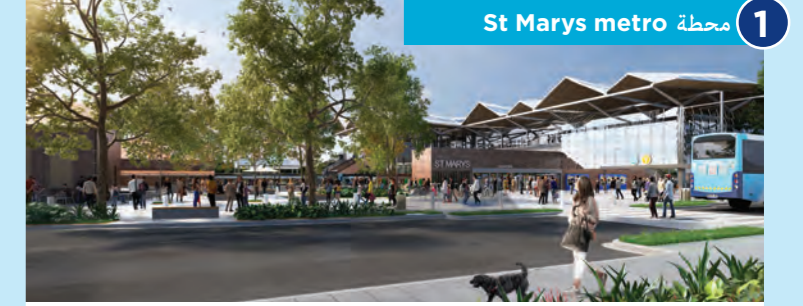
1 محطة St Marys metro

يعمل Sydney Metro مع أصحاب المصلحة والصناعة لإنشاء مشروع يوفر مترو سريع وآمن وموثوق به، ويدعم نجاح مدينة Western Parkland City المستقبلية ويربط المنطقة ببقية سيدني.