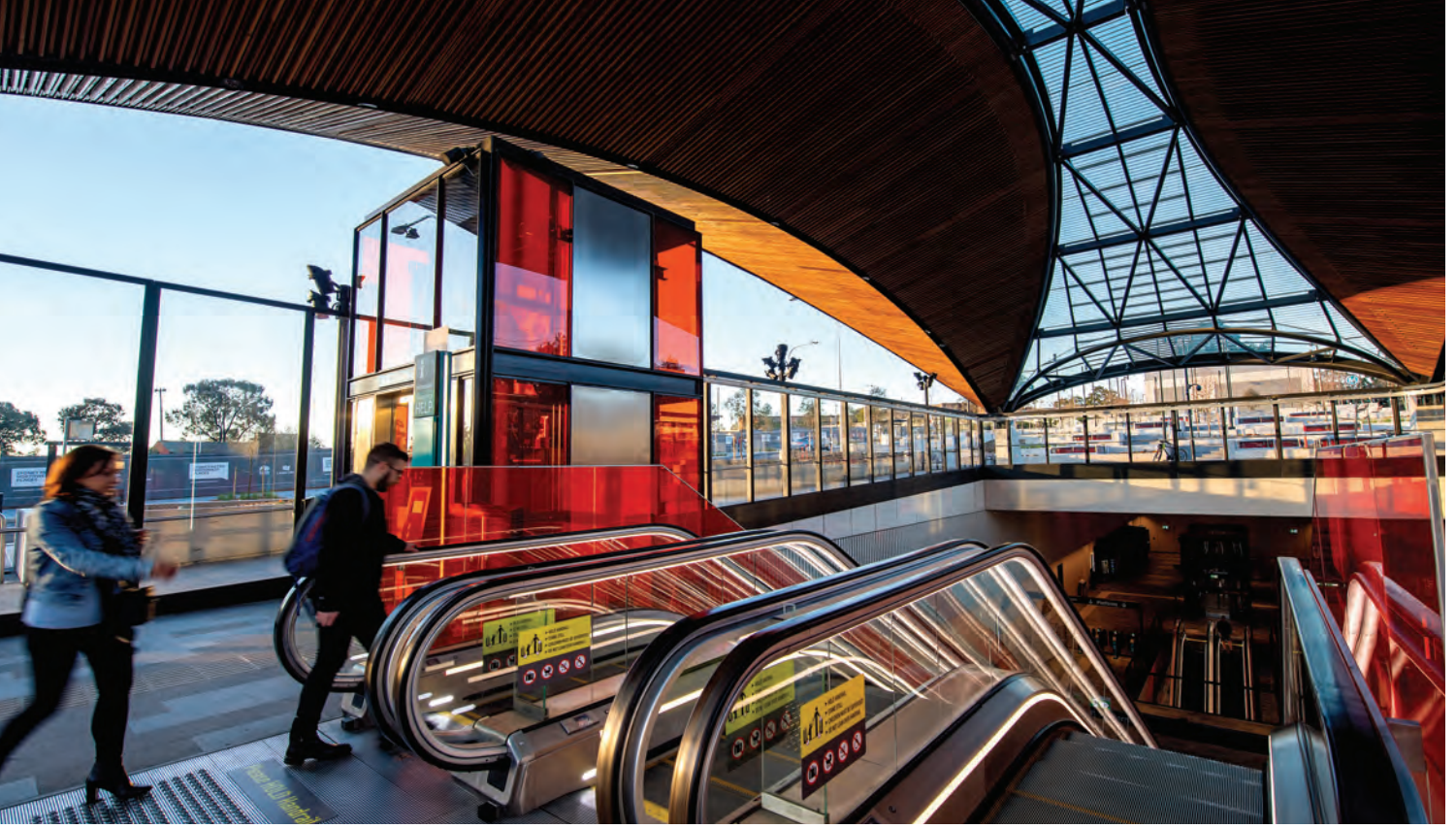
محطة Hills Showground، خط Metro North West.