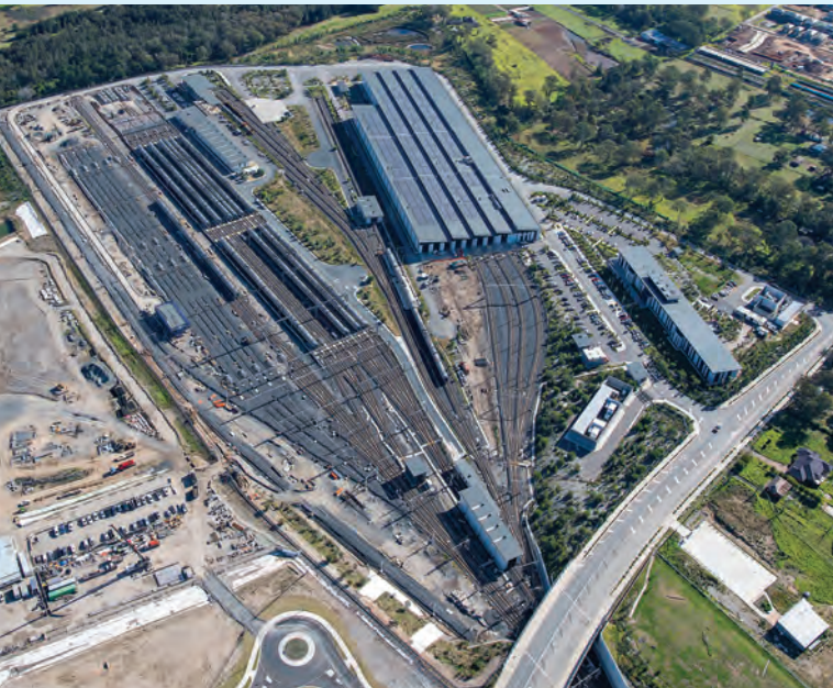
مرفق Sydney Metro Trains في Rouse Hill على خط Metro North West.

سيتمّ التحكم في خط المطار الجديد من منشأة Orchard Hills - Sydney Metro Trains.