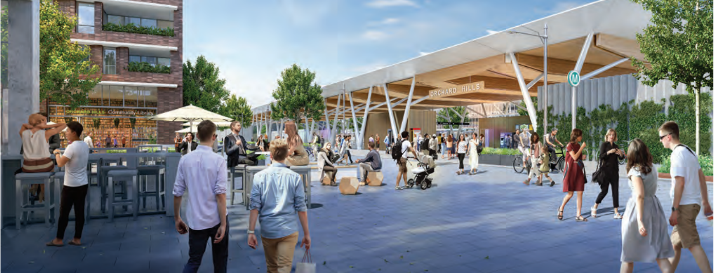
انطباع الفنان عن محطة Orchard Hills