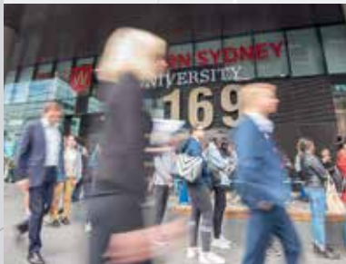
西悉尼大学，帕拉马塔。

根据计划，帕拉马塔地铁站的四周将分别是乔治街 (George Street)、麦考瑞街 (Macquarie Street)、教堂街 (Church Street) 和史密斯街 (Smith Street)，入口将位于霍伍德广场 (Horwood Place)。