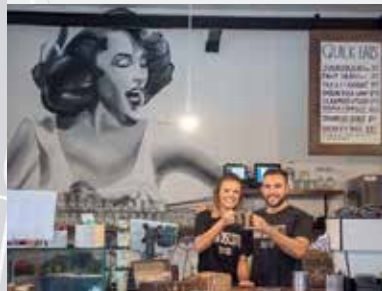
北斯特拉斯菲尔的一间咖啡馆

北斯特拉斯菲尔地铁站计划将毗邻现在的北斯特拉斯菲尔火车站。新的地铁站台将坐落在目前的火车站旁边，全新的地铁站入口将位于女王街(Queen Street)。