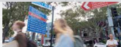
威斯特米德医院 Westmead Hospital.