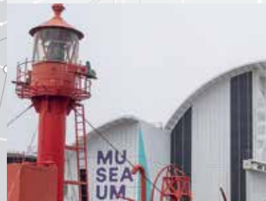
澳大利亚海洋博物馆。