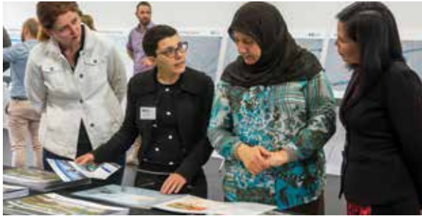
悉尼地铁的一项社区活动。