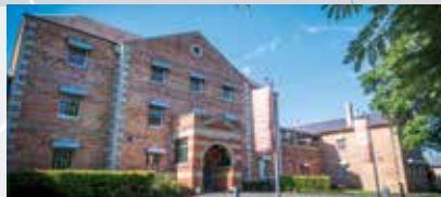
西悉尼大学，莱德米尔。