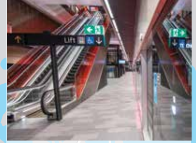
悉尼的一个地铁站。

规划的悉尼市中心地铁站的位置将在进行进一步地调查、咨询了社区和利益相关者的意见之后得到确定。