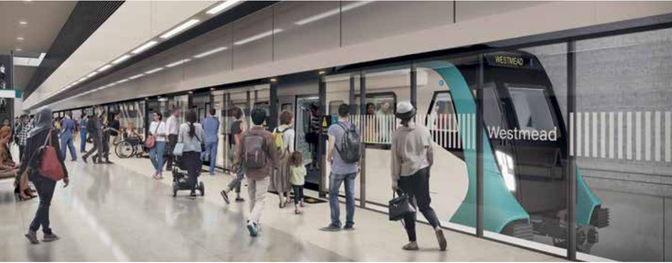
انطباع الفنان عن محطة مترو ويست