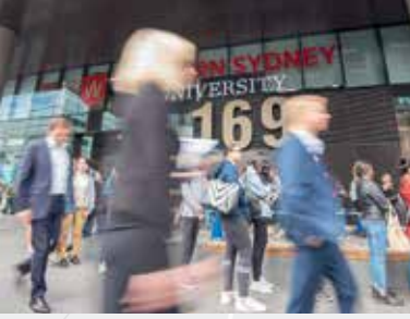
جامعة ويسترن سيدني، پاراماتلا

ستكون محطة مترو Parramatta المقترحة على قطعة الأرض المحاطة بشوارع George و Church و Macquarie و Horwood Place في مدخل في