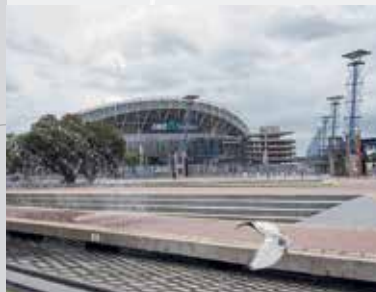
Sydney Olympic Park

تقع محطة مترو Sydney Olympic Park المقترحة جنوب محطة Sydney Olympic Park الحالية. تقع المحطة إلى الشرق من Olympic Boulevard مع مداخل المحطة الرئيسية بين Herb Elliot Avenue و Figtree Drive وقبالة Dawn Fraser Avenue.