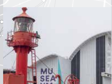
المتحف البحري الأسترالي.

Plymouth تعتبر Plymouth خيار محطة إستراتيجية خاضع للجدوى.