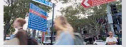
مستشفى ويستميد (Westmead)

Westmead تقع محطة مترو Westmead المقترحة على الجانب الشرقي من Hawkesbury Road، جنوب محطة Westmead الحالية. سيكون للمحطة مدخل واحد في Hawkesbury Road.