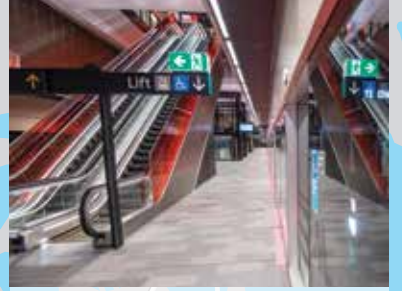
محطة سيدني مترو.

المنطقة التجارية المركزية لسيدني (Sydney CBD) سيتم تحديد موقع محطة سيدني CBD المقترحة بعد إجراء مزيد من التحقيقات وإشراك المجتمع وأصحاب المصلحة.