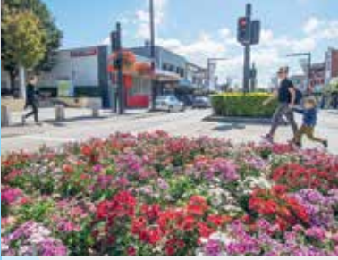
Five Dock, Great North Road

Five Dock تقع محطة Five Dock المقترحة قبالة East Street، بين Great North Road و Second Avenue عند زاوية Waterview Street. سيكون مدخل المحطة في Fred Kelly Place قبالة Great North Road.