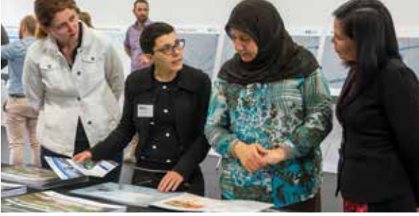
حدث مجتمعي لسيدني مترو.

سيتواصل مدراء الإستحواذ والشخصيون التابعين لنا مع أي مالك أو مستأجر تتأثر ممتلكاته مباشرة بالمشروع..