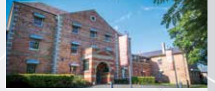
جامعة ويسترن سيدني، Rydalmere

Rydalmere يتم اعتبار Rydalmere كخيار محطة إستراتيجية خاضع لدراسة الجدوى.