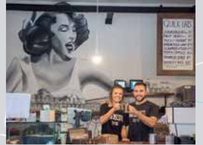
مقهى شمال ستراتفيلد.

ستكون محطة مترو North Strathfield المقترحة بجوار محطة North Strathfield الحالية، وستقع منصات المترو الجديدة بجانب المحطة الحالية وسيكون الدخول إلى المحطة من مدخل جديد في Queen Street.