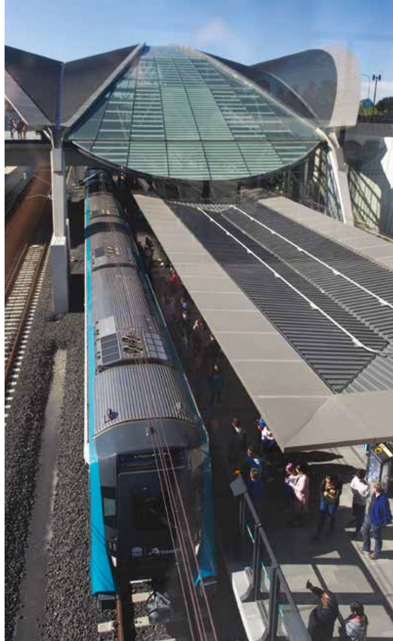
2019年5月26日塔拉旺(Tallawong)站地铁西北线(Sydney Metro West)开通日。