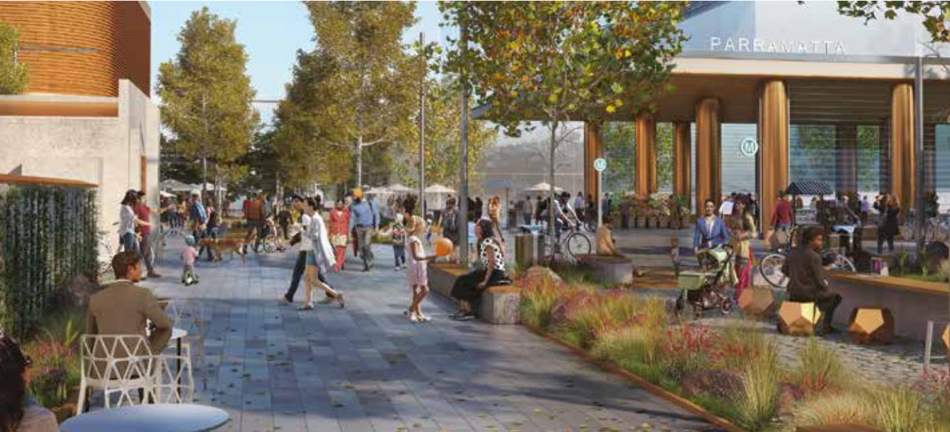
帕拉马塔 (Parramatta) 地铁站效果图。