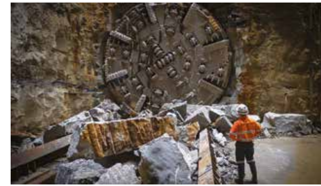
文迪隧道掘进机(TBM Wendy)在悉尼地铁市(Sydney Metro)中心与西南线项目的蓝点区(Blues Point)挖凿突进。

该项目将启用四台隧道掘进机挖凿从威斯特米德(Westmead)到湾区(The Bays)之间超过20公里长的隧道。两台隧道掘进机将在Westmead 地铁站工地启用，另外两台在The Bays 地铁站工地启用。所有的隧道掘进机都将在悉尼奥林匹克公园(Sydney Olympic Park)收机。隧道平均的深度将是38米或13层楼深。