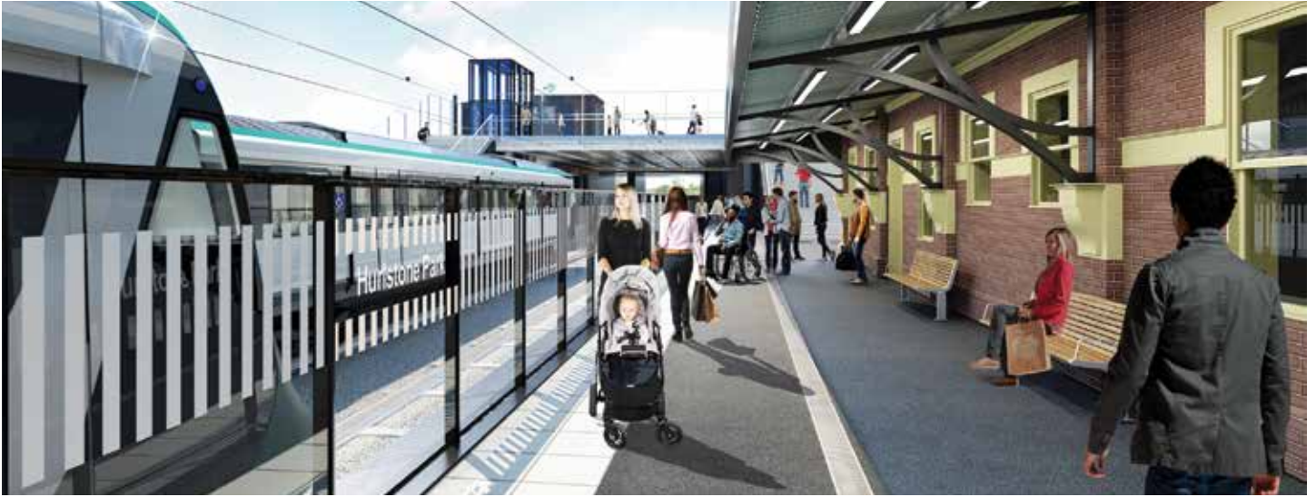
Ảnh tượng của nghệ nhân về trạm Hurlstone Park