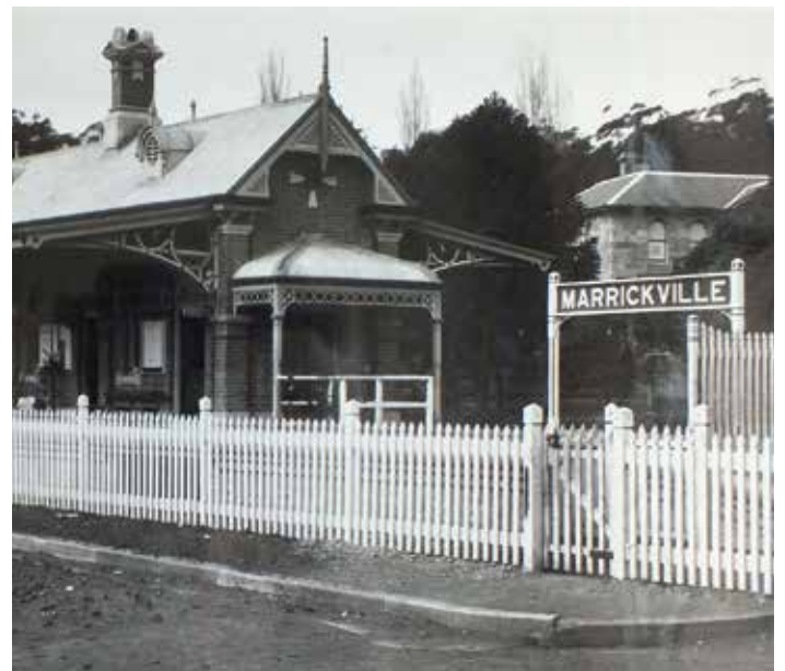
Trạm Marrickville năm 1895

Các sân ga đã được ghi vào di sản tại hầu hết các trạm trong danh sách sẽ được nâng cấp, và các sân ga ở Bankstown sẽ được sửa đổi chút ít.