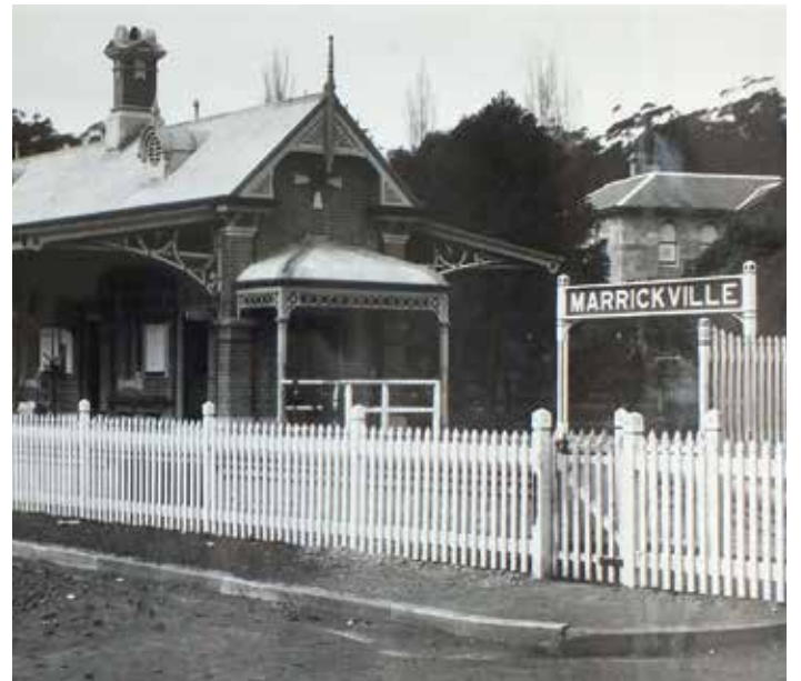
Marrickville स्टेशन 1895

धरोहर के तौर पर सूचीबद्ध प्लेटफॉर्मों को अधिकांश स्टेशनों पर फिर से समतल किया जाएगा, और Bankstown पर धरोहर के तौर पर सूचीबद्ध प्लेटफॉर्मों पर मामूली समायोजन कार्य किए जाएंगे।