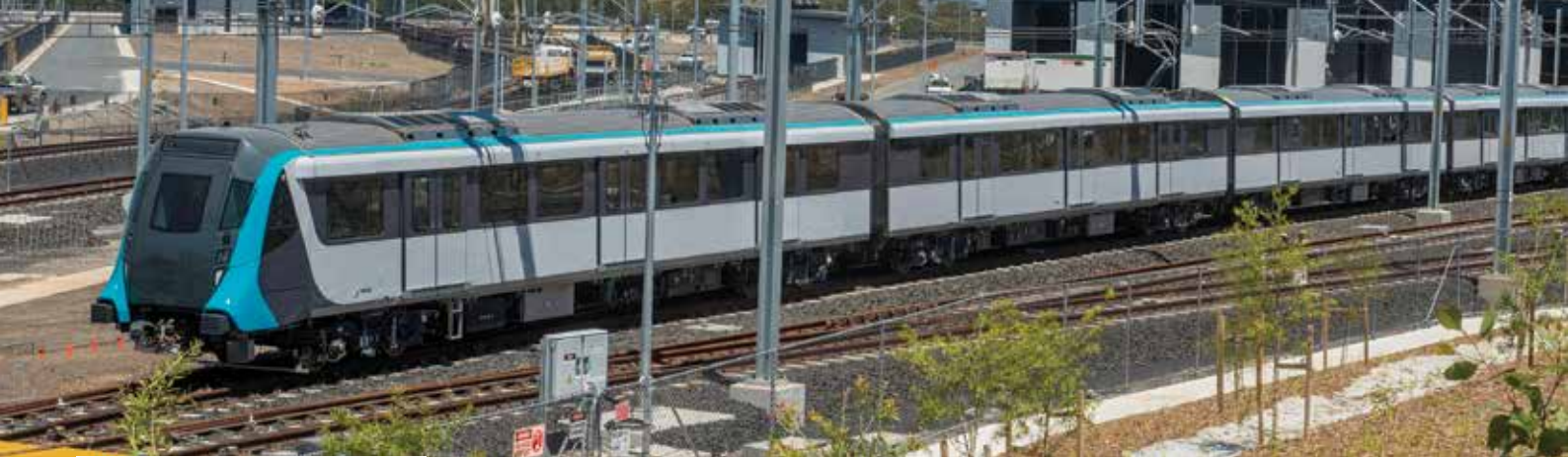
सिडनी की नई मेट्रो ट्रेन