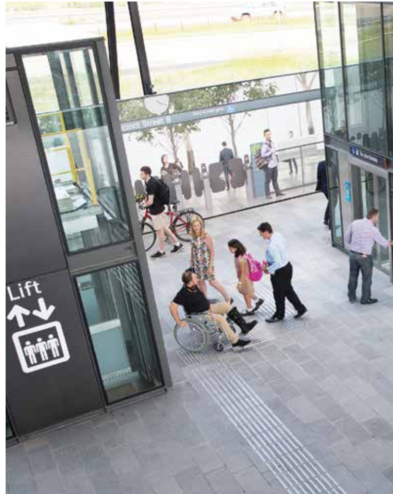
Πρότυπος σταθμός του Μετρό του Σύδνεϋ