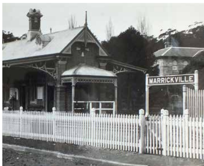
Σταθμός Marrickville 1895

Οι αποβάθρες που καταγράφηκαν ως πολιτιστικής κληρονομιάς θα αναπροσαρμοστούν στους περισσότερους σταθμούς και θα γίνουν μικρές προσαρμογές στις αποβάθρες πολιτιστικής κληρονομιάς στο Bankstown.