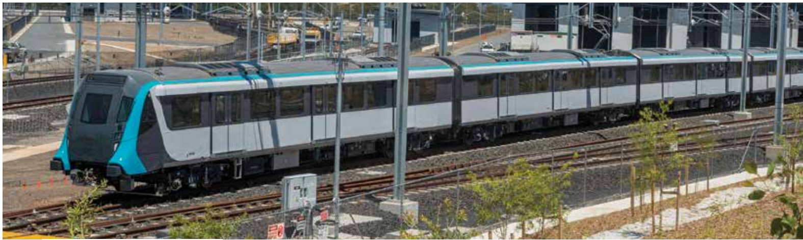
Το νέο τρένο του Μετρό του Σύδνεϋ